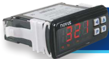
CONTROLADOR PARA REFRIGERACIÓN / CALEFACCIÓN