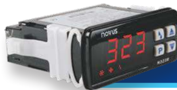
CONTROLADOR PARA REFRIGERACIÓN CON DESHIELO