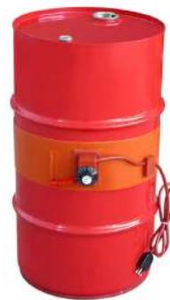
Modelo CDM 50L