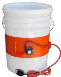
Modelo CDM 25L

Las fajas calefactoras de silicona permiten mantener la temperatura de la zona específica que se desea temperar. Reduce la viscosidad de los materiales lo que les permite ser bombeado o vertido con facilidad.