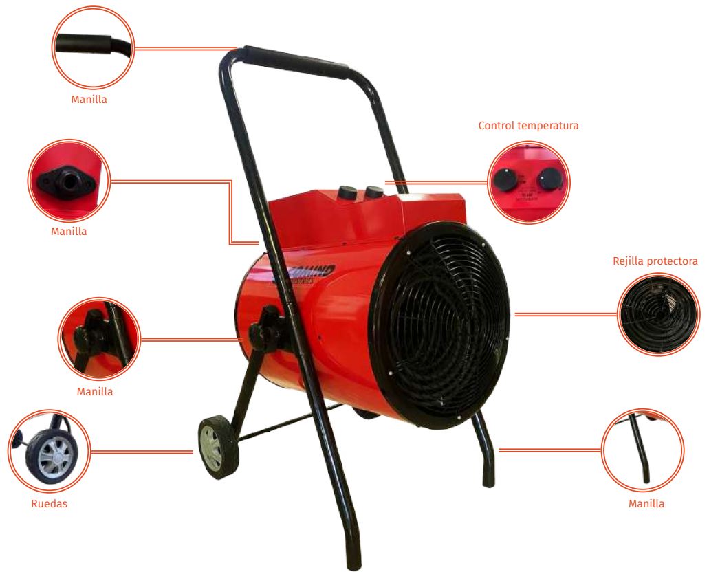
DIAGRAMA DE MEDIDAS