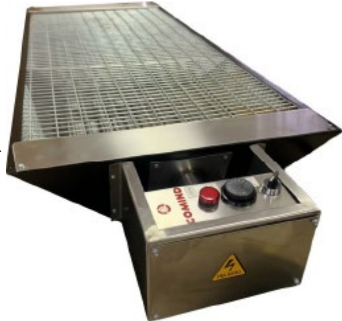
MEDIDAS SEGUN MODELO PANTALLA RADIANTE