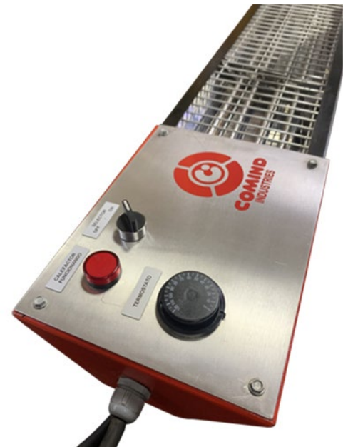
MEDIDAS SEGUN MODELO PANTALLA RADIANTE